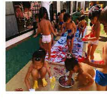
暑い日 は これに 限る？